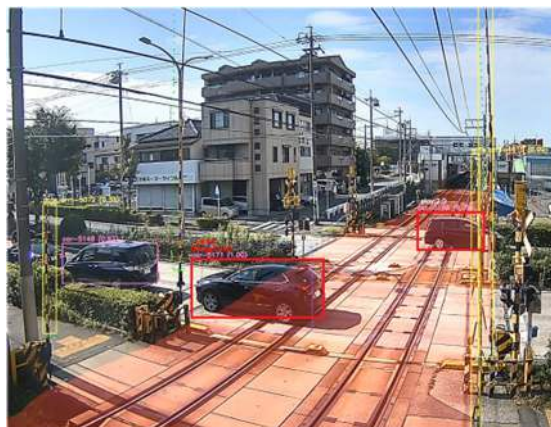
AI画像解析装置により物体を検知している様子（イメージ）

このような状況に対して、交通に関わる事業者が互いに協力し、AI画像解析を活用した事故を未然に防ぐシステムの構築を目指し、踏切の安全性を向上するための仕組みを導入します。