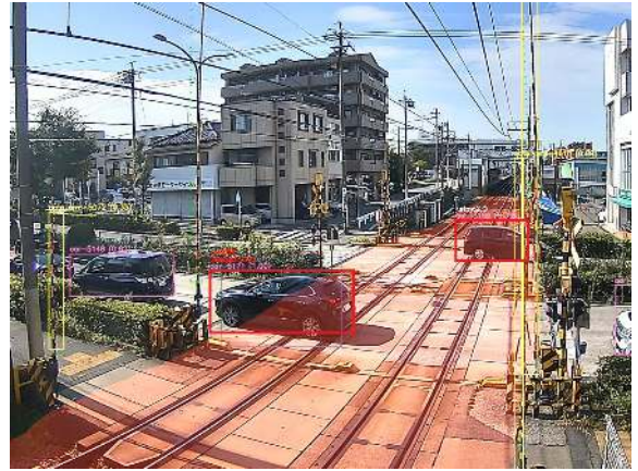
カメラからの画像で物体を 検知している様子（イメージ）

現行における踏切内の異常を検知する装置は、「踏切内に物体が存在しているかどうか」を検知しています。踏切が動作して遮断桿が下りている間で踏切内に物体を検知すると、踏切周辺の信号機が自動的に反応して、付近を走行中の列車に異常を知らせています。