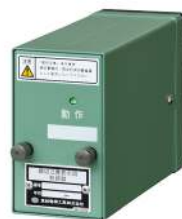
【踏切注意表示用断続器】