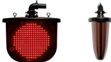
【列車接近時・裏面も同様です】