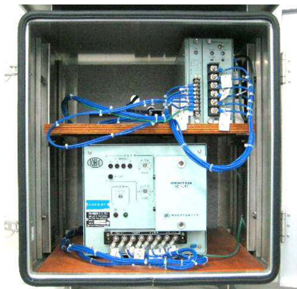
機器収納側実装写真