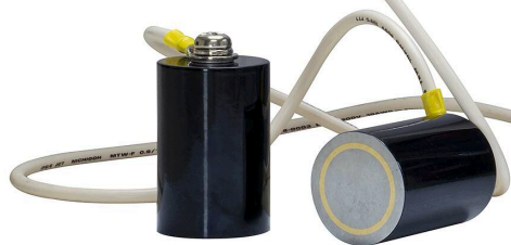
【マグネットタイプの短絡コード】